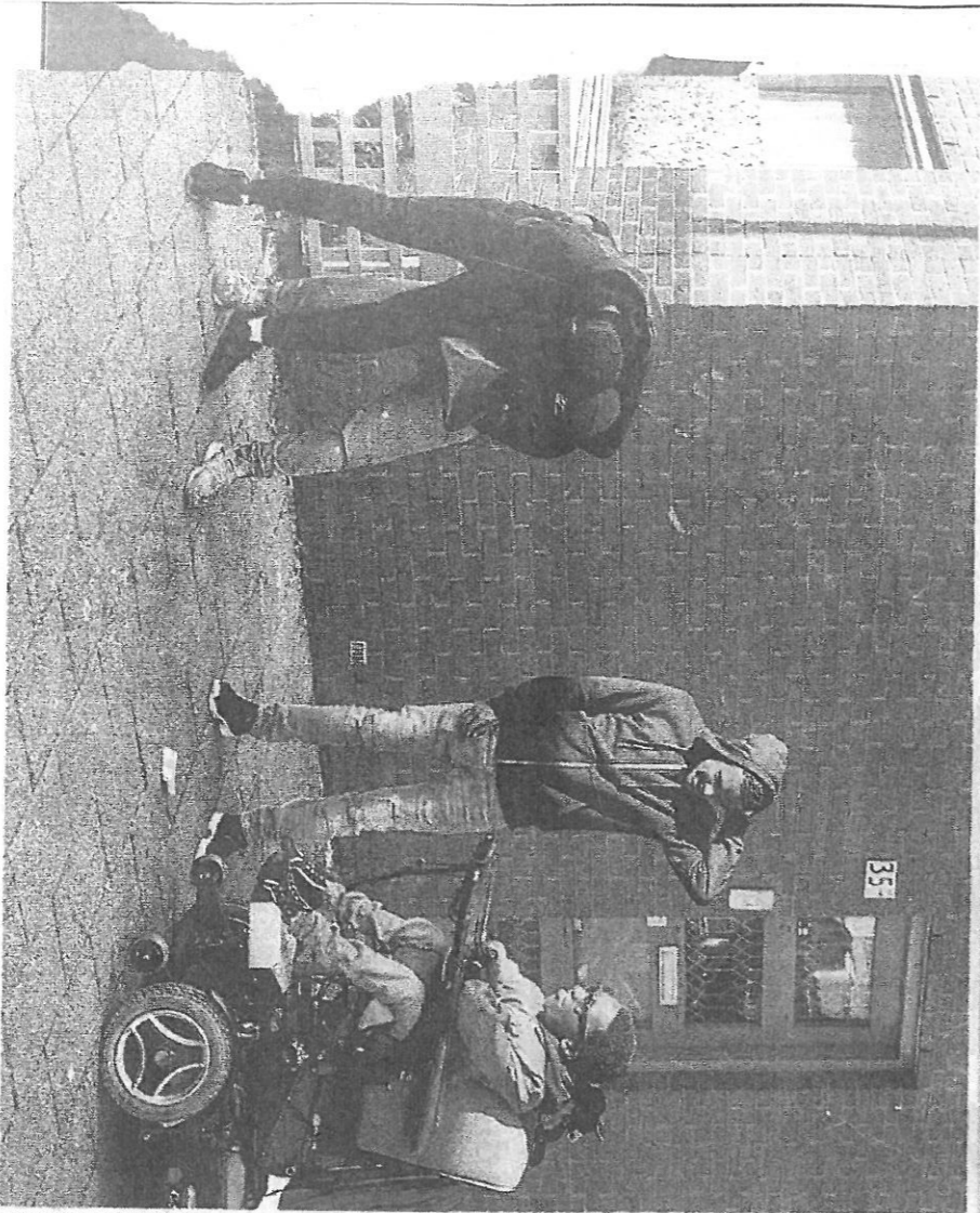
Een zomeravond in de volkswijk Feijenoord-Hillesluis